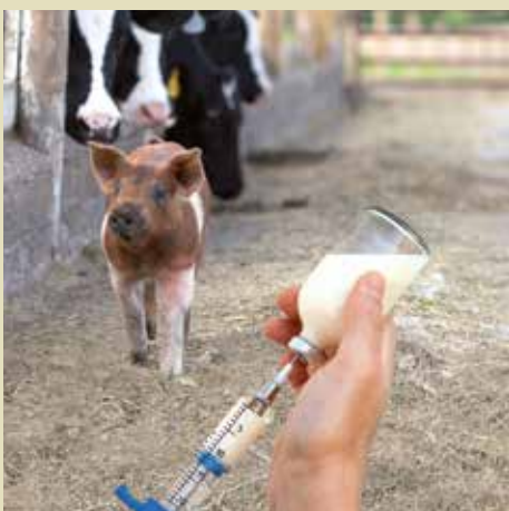
Πριν την ανακίνηση